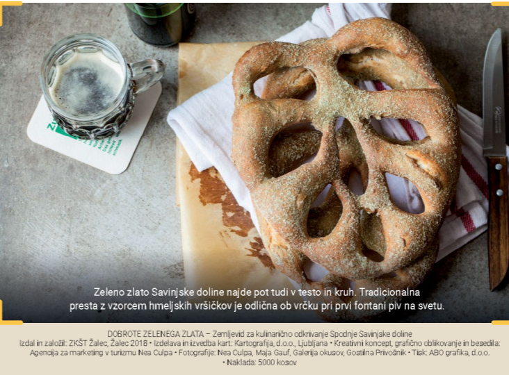
Zeleno zlato Savinjske doline najde pot tudi v testu in kruh. Tradicionalna presta z vzorcem hmeljskih vršičkov je odlična ob vrčku pri prvi fontani piv na svetu. DOBROTE ZELENEGA ZLATA – Zemljevid za kulinarčno odkrivanje Spodnje Savinjske doline Izdal in založil: ZKŠT Žalec, Žalec 2018 • Izdelava in izvedba kart: Kartografija, d.o.o., Ljubljana • Kreativni koncept, grafično oblikovanje in besedila: Agencija za marketing v turizmu Nes Culpa • Fotografije Nes Culpa, Maja Gauf, Galerija Okusov, Gostilna Privošnik • Tisk: ABO grafika, d.o.o. • Naklada: 5000 kosov

NASTANITVE 29 Hotel Žalec E4 Mestni trg 3, 3310 Žalec t +386 (0)3 713 17 00 w www.hotel-zalec.si † hotel 51 Hostel Plus Caffè F4 Petrovče 243, Petrovče t +386 (0)40 307 700 w www.hostelplus.si † hostel 52 B&B Dvorec F4 Dobriša vas 18, Petrovče t +386 (0)41 250 949 w www.bbdvorec.com † sobe in tradicionalni slovenski zajtrk 37 Pizzeria & Grill Verde F4 Petrovče 94, Petrovče t +386 (0)3 714 00 50 w www.verdebar.com † sobe 53 Guest House Šempeter D4 Ob Strugi 5, Šempeter t +386 (0)41 686 156 † sobe 2 Turistična kmetija Podpečan G3 Galicija 51, Žalec t +386 (0)31 676 729 w www.kmetijapodpecan.si † apartmaji 7 Ekološka kmetija Kozman E2 Podkraj 4, Velenje t +386 (0)51 617 951 w www.eko-kmetija.eu † leseni šotori 4 Izletniška kmetija Tratnik F6 Pongrac 165, Grize t +386 (0)40 741 942 w kmetija.tratnik.ek.si † kamp