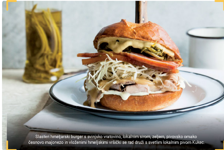
Slasten hmeljarski burger s svinjsko vratovino, lokalnim sirom, zeljem, pivovsko omako česnovno majonezo in vložnimi hmeljskimi vršički se rad druži s svetlim lokalnim pivom Kukec.

Fontana Zelena Zlato Nakup vrčka za pokušino piva na fontani: TIC Žalec, Trgovina Zeleno zlato, Ekomuzej hmeljarstva in pivovarstva Slovenije Fontana Zelena Zlato Prva fontana piv na svetu SLOVENIA GREEN INSTITUT ZA ZDRAVJE